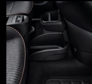
REF. 50290430 + 52199248