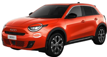
Orange - Sun of Italy