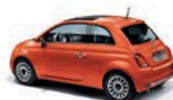
562 Spritz Orange