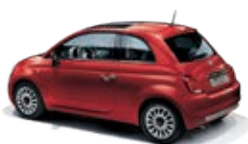
111 Passione Rot