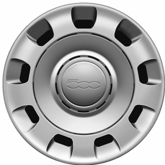
14" Stahlfelge 175/65 R14 (CULT)