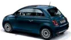
687 Dipinto di blu Blau