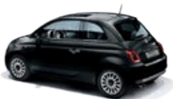
876 Vesuvio Schwarz