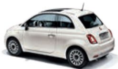
268 Gelato Weiss