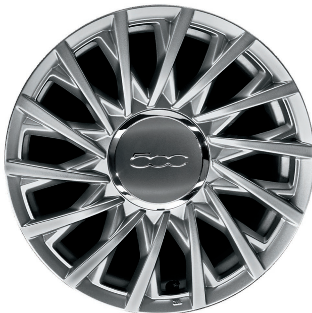
15" Leichtmetallfelge 185/55 R15 (LOUNGE)