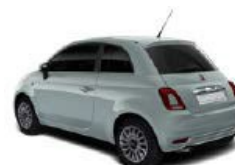
196 Rugiada Grün